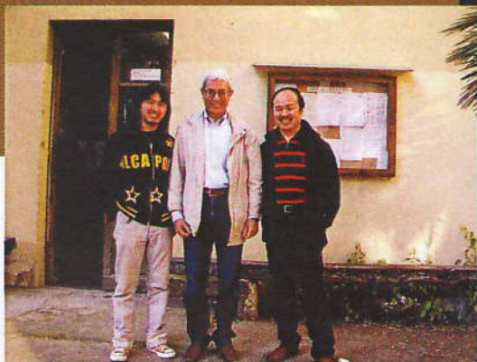
父子俩与维多利亚·弗玛斯教授合影。