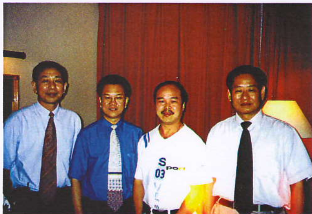
与温州市政协主席蒋云峰、副市长陈宏峰。