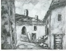
Alfred Manzi - « La Piazza » Page 26

Importante exposition de ce jeune sculpteur né a Naples, en 1944. Oeuvres personnelles, élancées, dont les formes suggèrent de grands mouvements dans l'espace. Envolées lyriques de grands oiseaux, avions, fusées. Les formes sont pures, délimitées par de larges lignes courbes ascendantes.